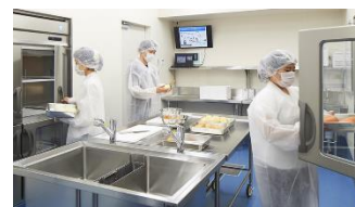
体験型衛生対策コーナー有 (事前予約)