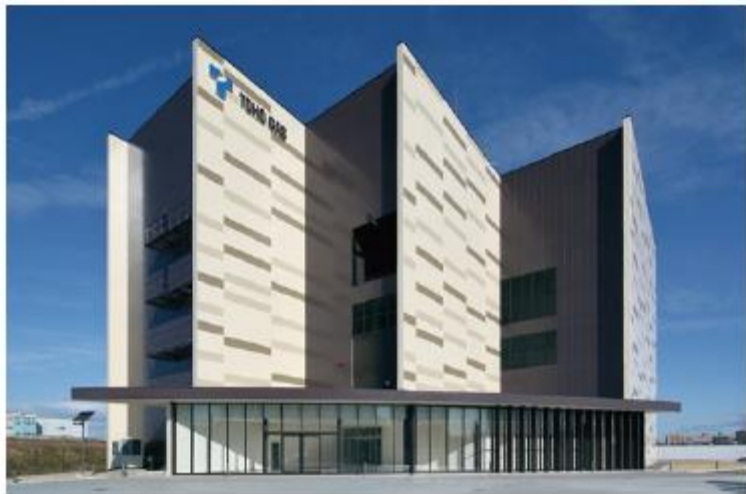
みなとアルクス エネルギーセンター-外観