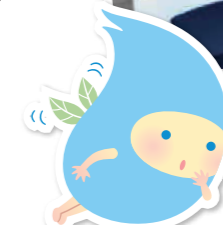
マスコットキャラクター ぼっぼちゃん