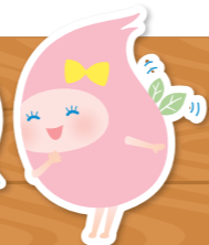
マスコットキャラクター びっぴちゃん