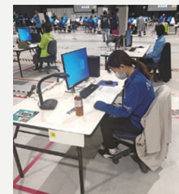
全国アビリンピック 競技の様子

2023年秋に開催された第43回全国障害者技能競技大会(全国アビリンピック)で、東邦フラワー(株)の社員が愛知県代表として出場。印刷物の編集や割り付けなどを行う「DTP種目」で銀賞を受賞しました。アビリンピックは、障がい者が日頃の業務で培った技能を競う大会で、毎年開催されており、2027年には世界大会も予定されています。