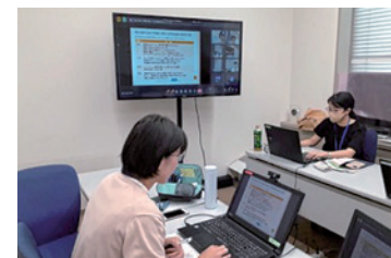
オンラインにて産休・育休セミナーを実施

また、ライフイベントを控えた特定の年齢層に向けた研修の開催や、社内外ロールモデルとの交流を通し、本人のキャリア形成支援を図っています。