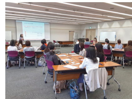
異業種交流型研修