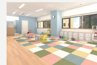
名古屋市港区の「邦和セミナープラザ」内に開所予定

障がい児通所支援事業は、小学校入学前の発達に課題を抱えるお子さまに対し、療育(個別のプログラムやサポートを提供し、健全な成長と社会参加を促進する支援)を提供するサービスです。東邦ガスグループは、本事業を通じ、くらしやビジネスのパートナーとして地域社会の療育現場を支え、そうした子供たちの独立を手助けすることで、持続可能な社会の実現に貢献していきます。