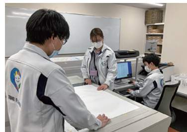
東邦フラワー(株)の職場