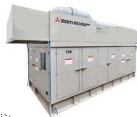
ガスエンジン コージェネレーションシステム

「エネファーム」、業務用にはガスコージェネレーションシステム、高効率ボイラ、ガスヒートポンプ (GHP) 空調など、エネルギー利用効率の高い機器・システムの普及を進めています。