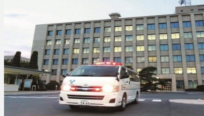
緊急開口部の活用