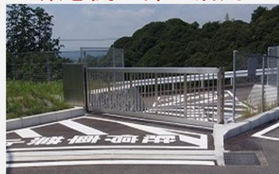
復旧拠点となるスペースの提供