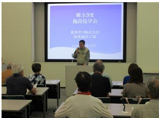
工場長から工場の概要をご説明

当社の主力工場である知多緑浜工場の構内で、世界最大級のLNGタンクや都市ガス製造方法の変遷について展示したモニュメントのご見学、LNG(液化天然ガス)の実物を用いた実験などをご覧いただきました。