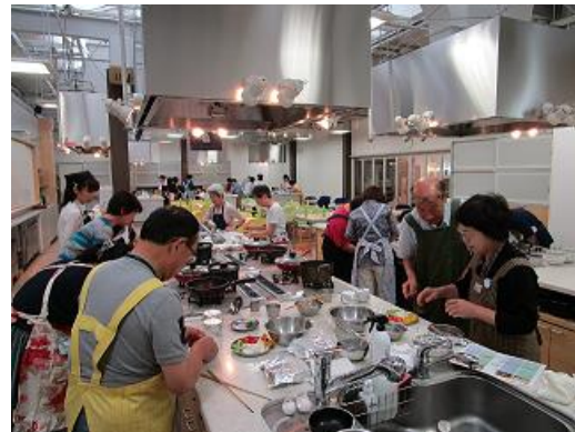
最新のガス機器を使って調理する皆さま(料理教室体験)