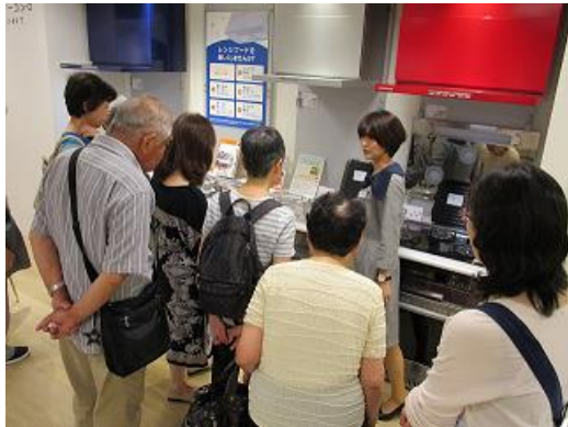
ショールームのアドバイザーが安心・便利なガス機器についてご説明(リベナス今池)

最新の家庭用ガス機器を展示し見て触れて体感できるショールーム「リベナス今池」では、見学後に料理教室で最新のガス機器を使って効率的に調理できる昼食メニューを作っていました。また、2018年9月にまちびらきしたスマートタウン「みなとアクルス」では、まち全体にガス・電気・熱を一括供給する「エネルギーセンター」と東海地区最大級の業務用厨房ショールーム「プロ厨房オイス」の2つの施設をご見学いただきました。