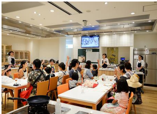
講師がお子さまにもわかりやすく調理方法をご説明(お子さまと楽しめる料理教室)

東邦ガスとカゴメ両社の株主さまを一同に会する料理教室として「お子さまと楽しめる料理教室」と「女性限定の料理教室」の2コースを開催しました。トマトをふんだんに使ったメニューを参加者の皆さまに最新のガス機器を使って調理していただきました。