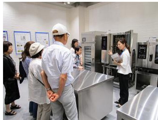
スタッフがさまざまな業務用厨房機器をわかりやすくご説明(プロ厨房オイス)