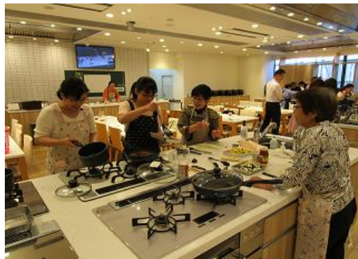
歓談・協力しながら調理する皆さま(女性限定の料理教室)