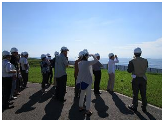
LNGタンク横から伊勢湾の対岸にある当社四日市工場方面を眺める皆さま