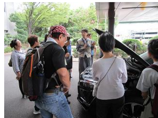
燃料電池自動車のしくみをご説明した後、皆さまが順にご試乗

今後も、株主さまに当社の事業活動へのご理解を深めていただけるよう、様々な施設見学会を実施して参ります。より多くの株主さまのご応募をお待ちしております。