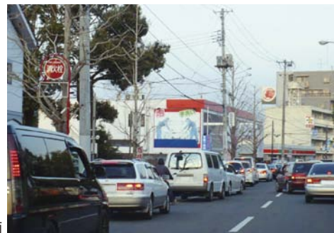
ガソリンスタンドに並ぶ車両