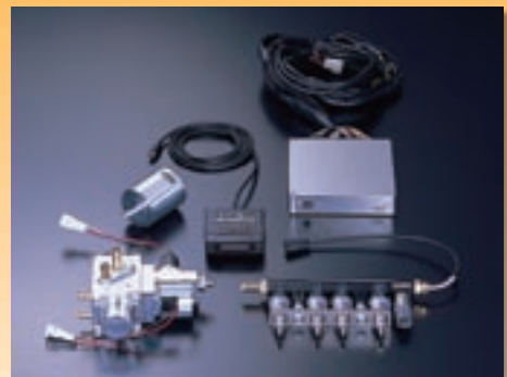
設定車種(随時車種展開予定)

HKSバイフューエルシステムは市販ガソリン車を改造するコンバージョンキットとして既存車両が備えている実用性や趣向性、機械的性能を損なうことなく、手軽に天然ガス自動車へと変換することが可能な車種別キットとして、今後、業務用車両を中心に車種展開を図っていく予定です。