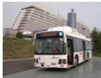
ウィンザーホテルとCNGバス

また、日本の誇る低公害車や次世代自動車に関係者の移動用チャトルバスとして利用され、天然ガス自動車のバスもウィンザーホテルへの移動や5,000人以上のプレス関係者が集まったIMC内の移動手段として、多くの関係者の足として活躍しました。