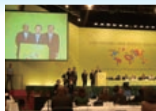
COP9会場でのスピーチの様子

愛知・名古屋は、環境に配慮した会議運営を行うための支援体制の準備を整えていきます。さらに、COP10開催決定を契機とし、市民・企業・行政等の協働により生物多様性の恵みに「気づき」、「知り・学び」、「行動する」ムーブメントを創出し、国際社会の一員として持続可能な社会づくりに貢献するための行動を進めていきます。