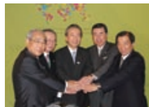
COP9会場での記者会見の様子