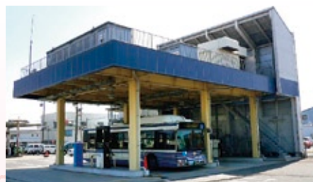
名古屋市交通局鳴尾営業所(南区)の天然ガス充てん所