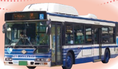
名古屋市交通局の天然ガスバス

天然ガスバスは名古屋市南部を中心に多くの路線を走っています。機会がありましたら、是非、環境にやさしい天然ガスバスにお乗りください。