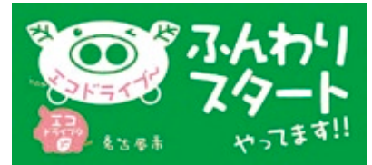
名古屋市のエコドライブステッカー