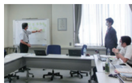
マテリアリティ ワークショップ

STEP1で抽出した個別課題を基に、ワークショップにおいてマテリアリティ候補を検討。持続可能な社会と新たな東邦ガスグループビジョンの実現に向け、縦軸を社会的価値、横軸を経済的価値とする2軸で、個別課題をマッピングしました。そのうち、共通する要素を持つ課題のグルーピングを実施しました。