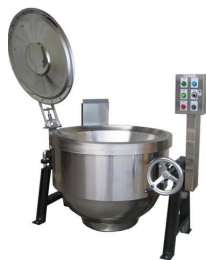
業務用厨房機器「涼厨」(回転釜)

涼しく快適な厨房を実現するために、室内への放射熱を抑えたガス機器です。学校・病院の給食や外食チェーン店などにご採用いただき活躍しています。