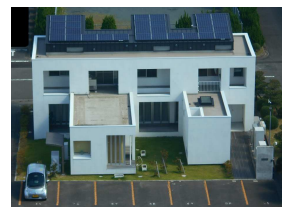
スマートエネルギーハウス

環境性と快適性を両立した暮らしの実現に向けて、燃料電池・太陽電池・蓄電池の3電池を連携して制御する技術などの実証を行う住宅です。