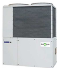
GHP(ガスヒートポンプ)

電力消費量を削減し、環境にもやさしい空調システムです。商業・医療・教育施設などで広く利用されています。