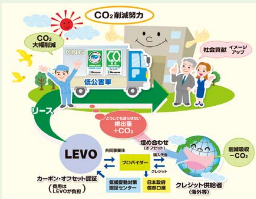
図1：LEVOリースイメージ

LEVOのカーボン・オフセット付CNG車には、環境省の認証基準に則った「カーボン・オフセット認証ラベル付きステッカー(図2)」及びLEVO独自の「カーボン・オフセット実績車両明示ステッカー(図3)」を貼付することができ、CNG車がCO 2 削減に貢献している商品であるという点をアピールすることができます。今回のLEVOのCNG車リースでは、このような環境省の基準に則った認証を得た車両をご活用いただくこととなりますので、荷主の皆さま、更には広く一般の皆さまに、地球規模でのCO 2 削減に貢献している企業であることをアピールできるなど、様々な効果を発揮できるものと考えられます。