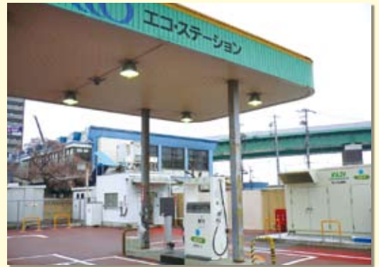
港明エコ・ステーション